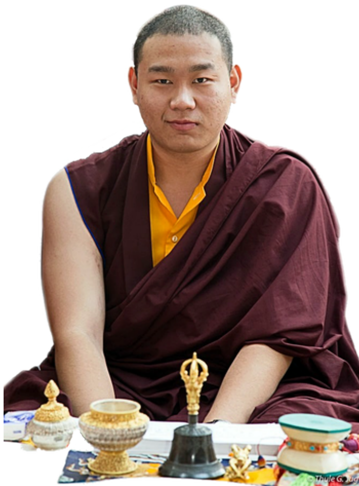
Den fjerde Jamgon Kongtrul Karma Mingyur Dragpa Senge

(Karmapa Thinle Taye Dordje's genkendelse)