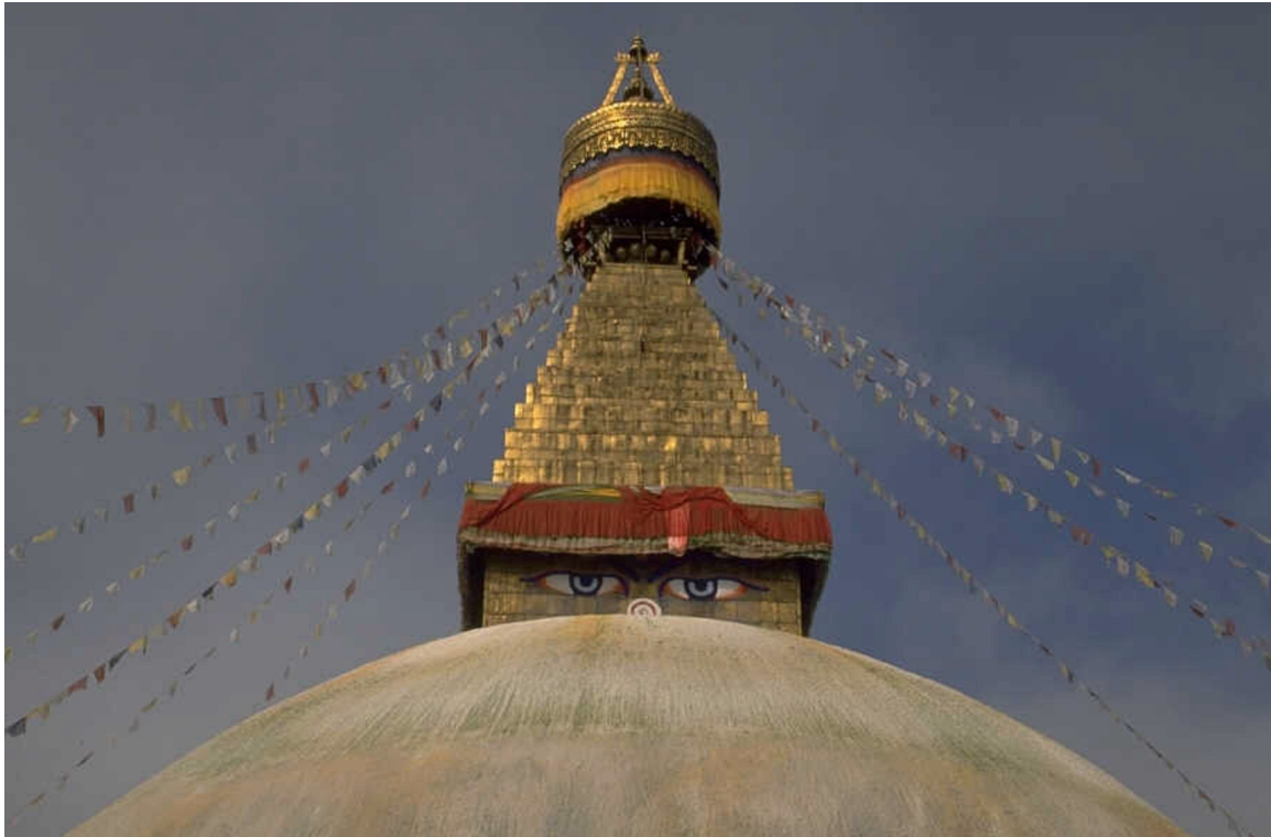
Bodanath stupaen i Kathmandu, Nepal