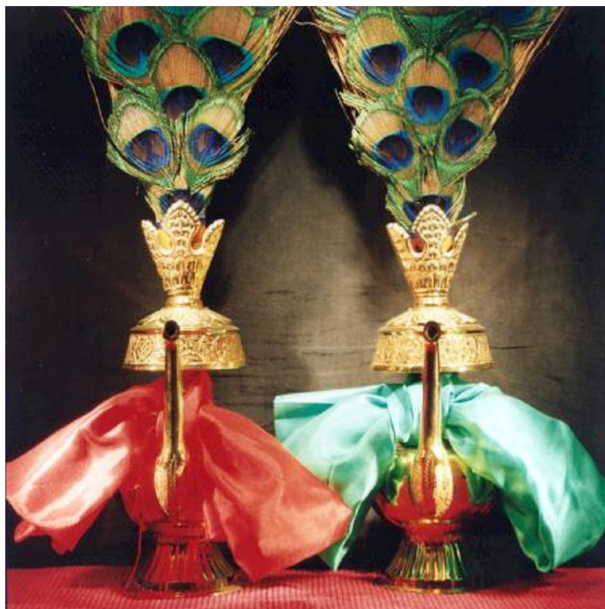
Rituelle vaser eller kander, symbol på sindets rum

E n anden ting, der er værd at overveje, er, at også kroppen - i hvert fald som en oplevelse - er i sindet. Når vi dør, dør denne del af sindets indhold, men ikke resten – og slet ikke Buddhanaturen. Måske er det dét, der menes, med sjælens udødelighed. Udødelighed indenfor Buddhismen betyder, at vi ikke mister vores indsigt, når vi har opnået grader af den. I samme ånd må jeg naturligvis foreslå, at det evige liv betyder, at Jesus' sande elever ikke genfødes mere, men genopstår i Paradis i herlighed .