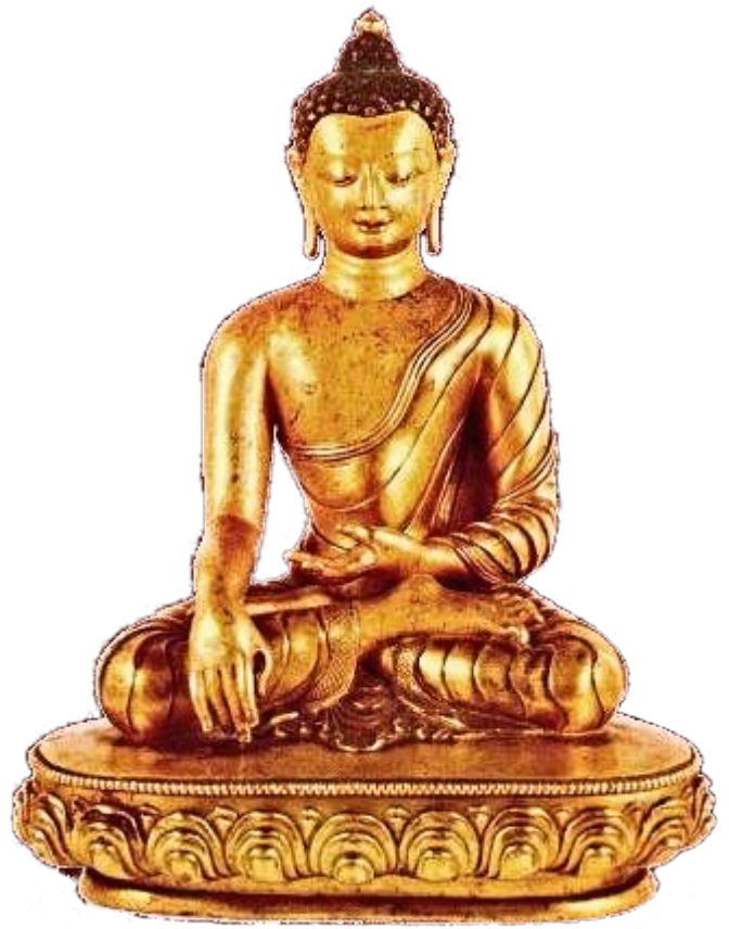
Buddha Sakyamuni's Nirvana